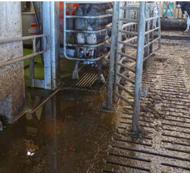
Ansammlungen von Kot und Harn vor der Roboterbox können zu einem Erregerreservoir werden.